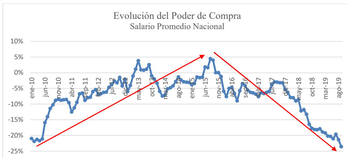
Tabla N° 3